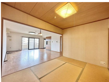
[専用部・室内写真][和室6帖あるのでゆったりくつろげますね]