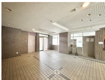
[共用部・設備施設][エントランスホール]エントランスホール

※公租公課その他当該物件を維持するために必要な諸経費の控除前のもので、予定賃料収入が確実に得られることを保証するものではありません。・※物件情報は下記情報公開日時時点のもので、現状が異なる場合は、現況優先となりますので、最新情報をご確認ください。